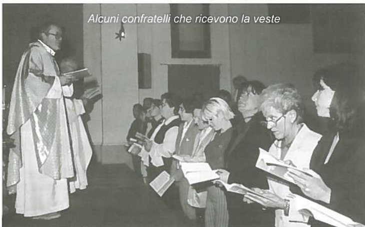
Alcuni confratelli che ricevono la veste