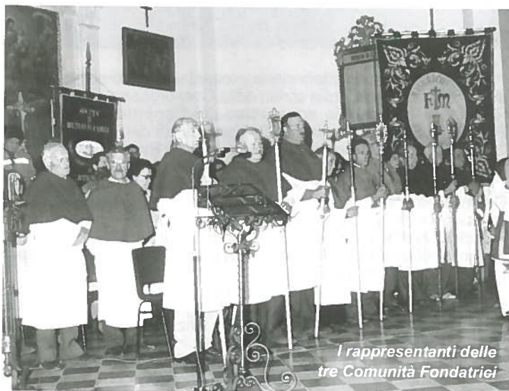
I rappresentanti delle tre Comunità Fondatrici

14/3/97 Nella chiesa del SS. Crocifisso, gremita di fedeli provenienti da tutte le frazioni del Comune, celebrazione ufficiale del giorno nel quale 100 anni prima nasceva la Misericordia. Indescrivibile la commozione tra i presenti quando è stato letto il verbale di fondazione e accesa la lampada del Centenario.