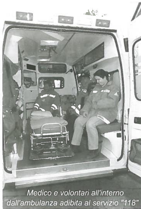
Medico e volontari all'interno dall'ambulanza adibita al servizio "118"