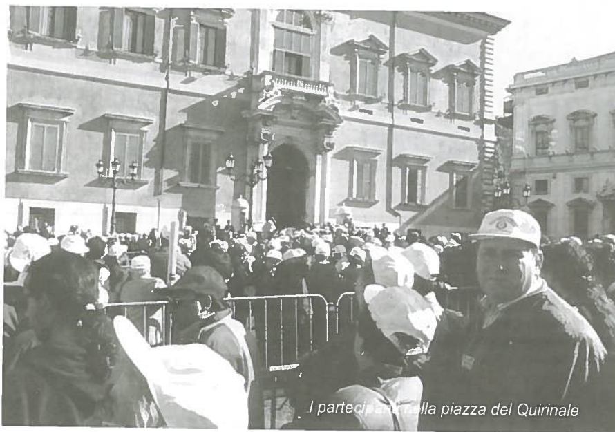
I partecipanti alla piazza del Quirinale

Il treno, sia all'andata che al ritorno, ha viaggiato sempre in anticipo sull'orario previsto.