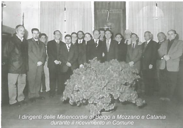
I dirigenti delle Misericordie di Borgo a Mozzano e Catania durante il ricevimento in Comune