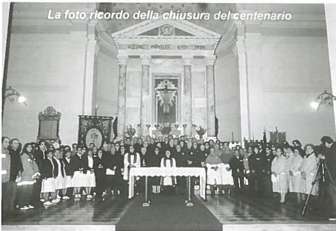
La foto ricordo della chiusura del centenario