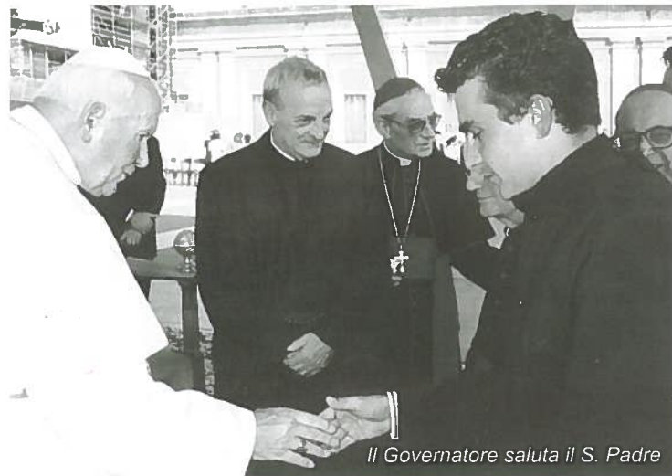
Il Governatore saluta il S. Padre

Evento eccezionale per tutta la Valle, in quanto era la prima volta che un treno di tali dimensioni transitava sulla linea Lucca-Aulla. Tantissima la gente di Borgo a Mozzano che la sera si è radunata