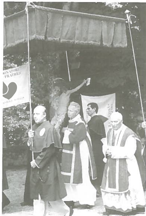
L'arrivo a Pescaglia del simulacro del SS. Crocifisso