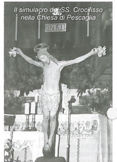
Il simulacro del SS. Crocifisso nella Chiesa di Pescaglia

29/6/97 Al Circolo L'Unione si e' tenuta la Festa del Volontariato con la consegna del diploma di soccorritore ai volontari.