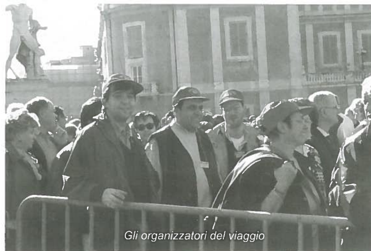
Gli organizzatori del viaggio

Organizzazione perfetta quella delle Misericordie, catastrofica quella delle Ferrovie dello Stato.