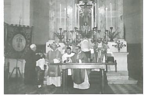
L'Arcivescovo benedice il nuovo altare

uniforme scortavano il Simulacro del SS. Crocifisso, che come vuole la tradizione, è sempre stato portato, sotto il baldacchino, dai sacerdoti presenti.