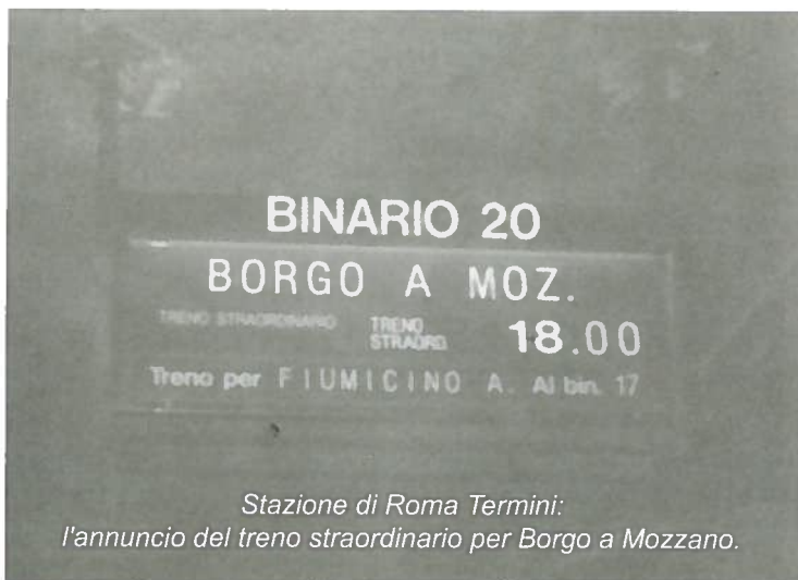
Stazione di Roma Termini: l'annuncio del treno straordinario per Borgo a Mozzano.

29/10/97 I medici del Dipartimento di Emergenza e Urgenza (DEU) incontrano i dirigenti della Misericordia.