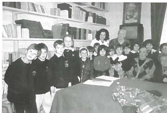
Alcuni alunni e anziani nella Biblioteca del Centro