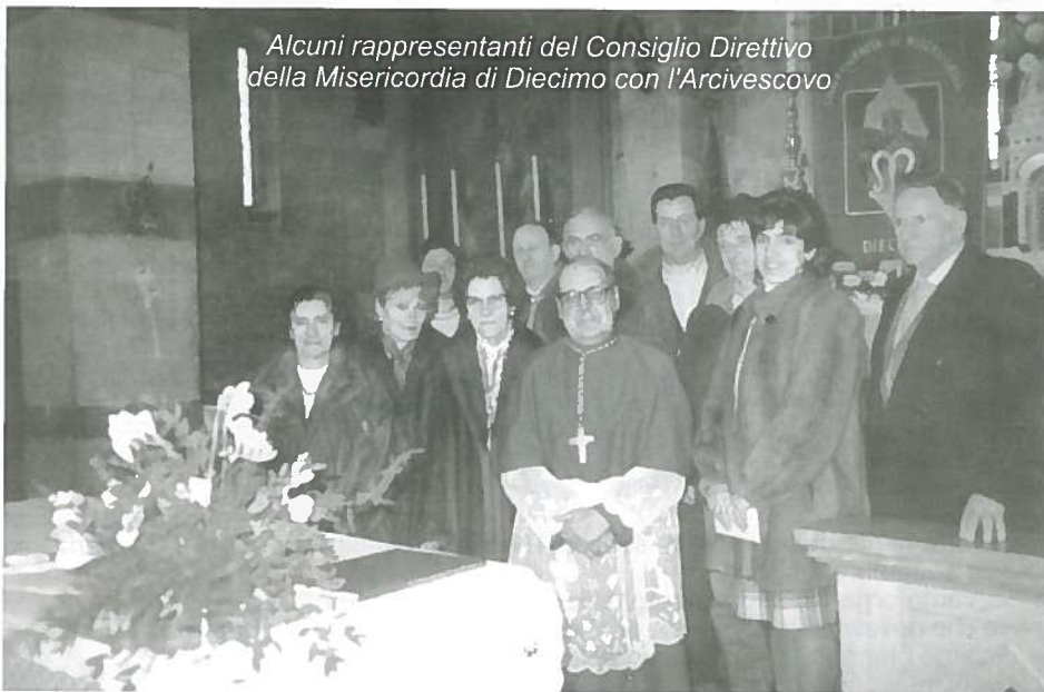
Alcuni rappresentanti del Consiglio Direttivo della Misericordia di Diecimo con l'Arcivescovo

La degna conclusione del ciclo di festeggiamenti e di manifestazioni si è poi avuta a Borgo a Mozzano, nella chiesa di S. Rocco, il 29 novembre scorso quando la Misericordia di Diecimo, insieme a quella, coeva, di Borgo a Mozzano, ha ricevuto dall'Amministrazione comunale un riconoscimento solenne pubblico e ufficiale. In una chiesa gremita, le due Istituzioni sorelle sono state festeggiate insieme, mentre un grande concerto della Corale del Duomo di Castelnuovo sanciva la felice conclusione delle manifestazioni per i 100 anni trascorsi, e segnava l'inizio di una nuova stagione che tutti ci auguriamo altrettanto ricca di opere di bene.