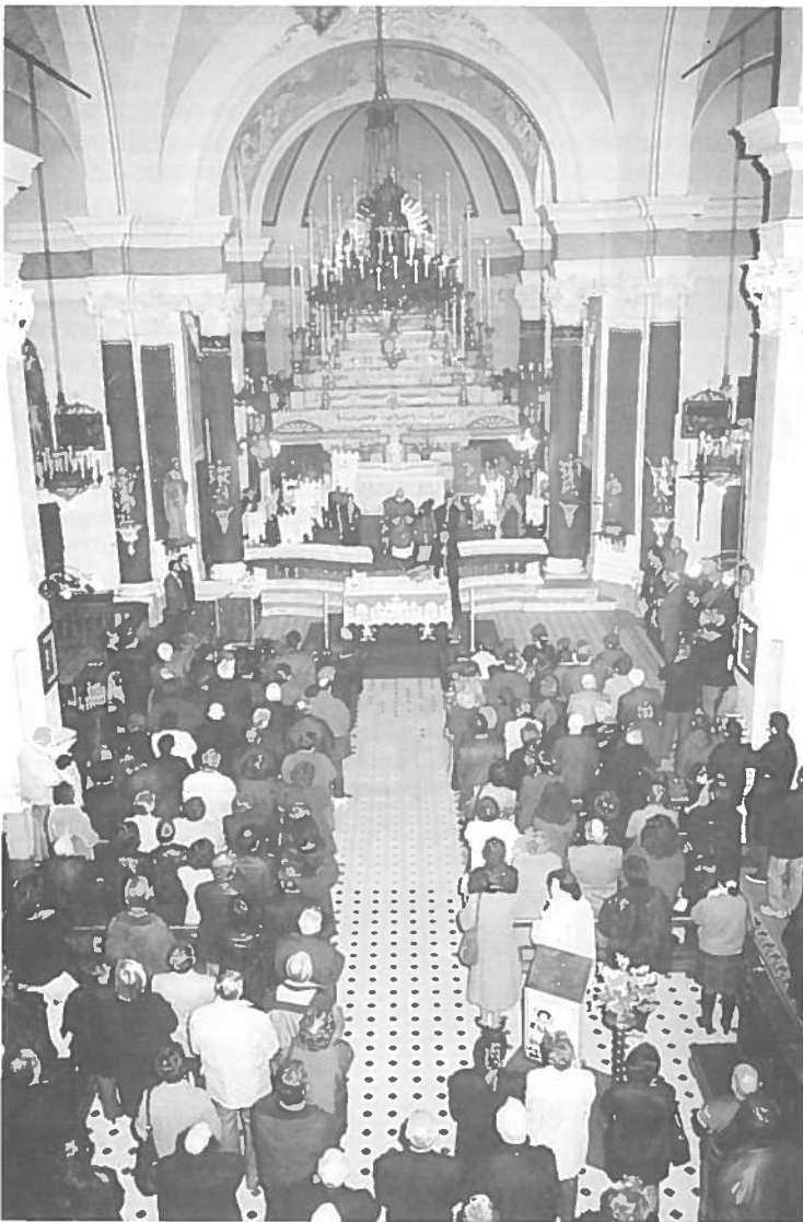
Chiesa di S. Rocco - XXX Anniversario di Fondazione del Gruppo Fratres