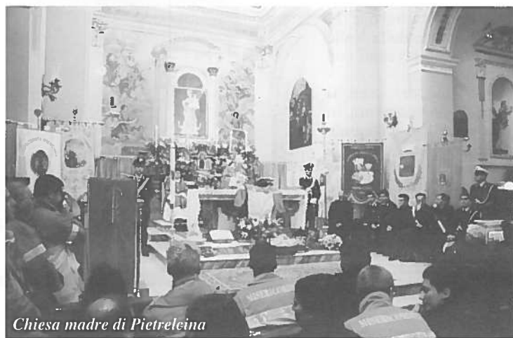
Chiesa madre di Pietrelcina