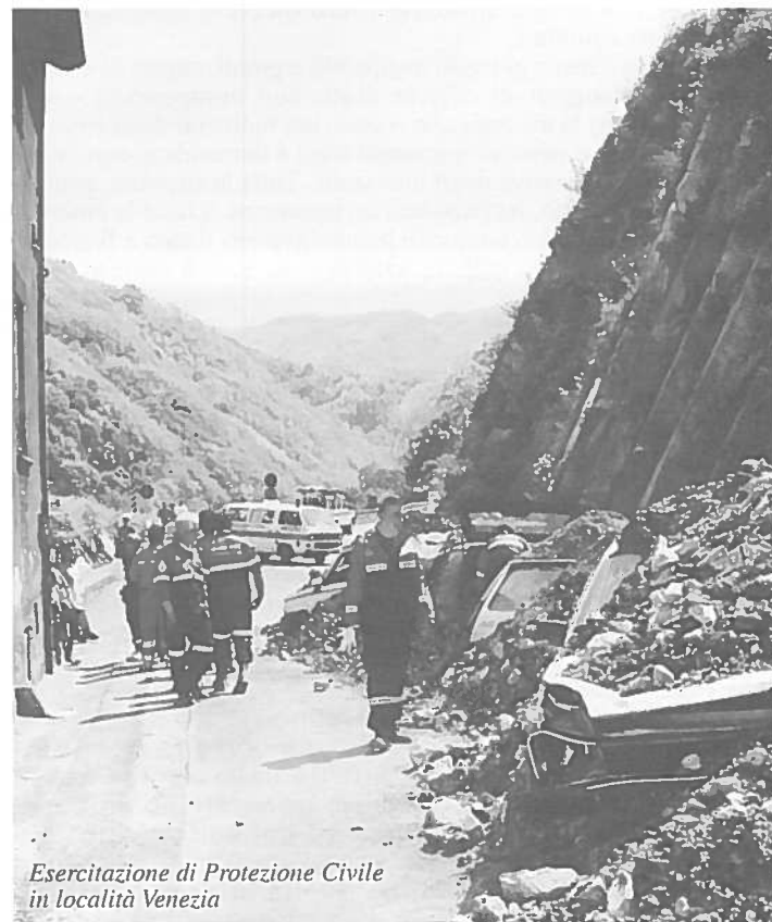
Esercitazione di Protezione Civile in località Venezia