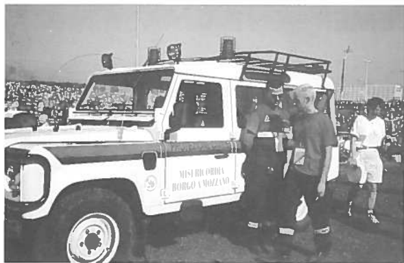
Roma, Tor Vergata - Assistenza al Giubileo dei Giovani

La prevenzione ha per scopo quello di prevenire l'evento catastrofico. Possiamo interpretare come tale l'informazione al cittadino rivolta al comportamento da tenere in caso di calamità, sapere su chi e cosa poter fare affidamento in caso di bisogno.