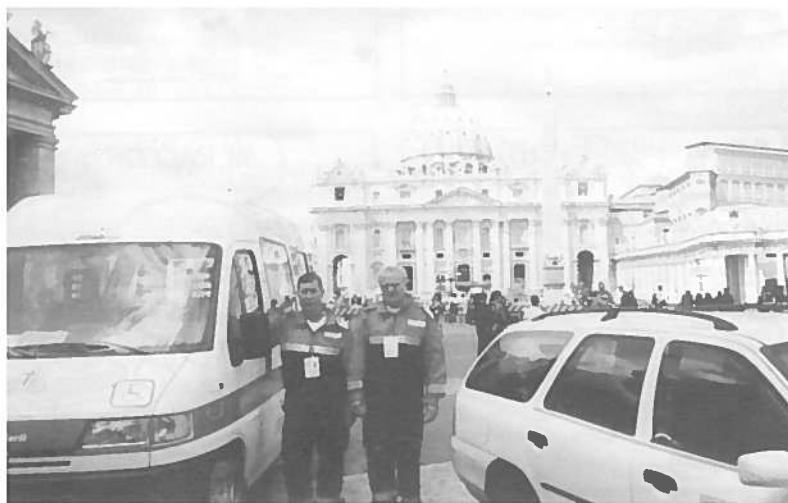
2000 Assistenza ai disabili durante i riti della Settimana Santa in Piazza San Pietro

L'IMPEGNO DELLA NOSTRA MISERICORDIA NON CONOSCE IL TEMPO