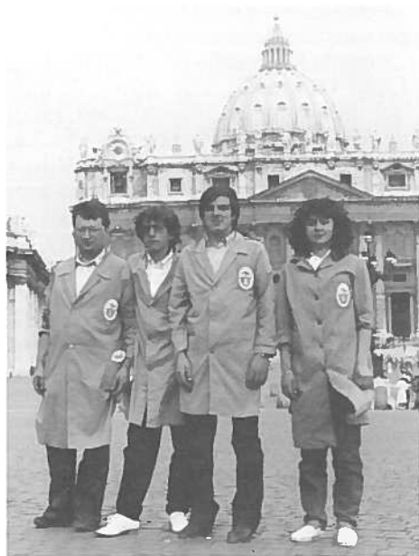
1981 assistenza sanitaria durante una manifestazione sportiva in Piazza San Pietro

Padre Ostilio conclude questo anno giubilare, con la celebrazione della S.Messa ed il Te Deum di ringraziamento.