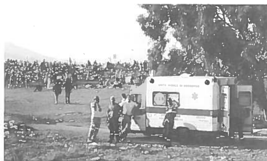
Roma, Tor Vergata - Assistenza al Giubileo dei Giovani

La pianificazione riguarda la gestione dell'emergenza e viene studiata in forma preventiva. La nostra Amministrazione Comunale in questi anni ha incaricato alcuni tecnici comunali della redazione di un piano di protezione civile. Individuare zone di accoglienza per sfollati, conoscere le zone a rischio del territorio, sfruttare le risorse in mezzi e uomini secondo precisi protocolli, disponibilità di vettovagliamento, generi alimentari e molto altro fanno parte di questo piano. Meccanismo essenziale del buon funzionamento di questa macchina è, oltre ai preposti, il Volontariato.