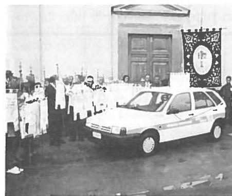
Inaugurazione della "FIAT TIPO"