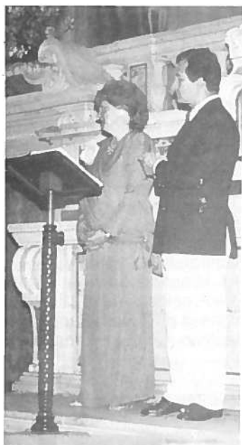
Il concerto lirico

La Misericordia dona un ambulatorio al paese di Partigliano.